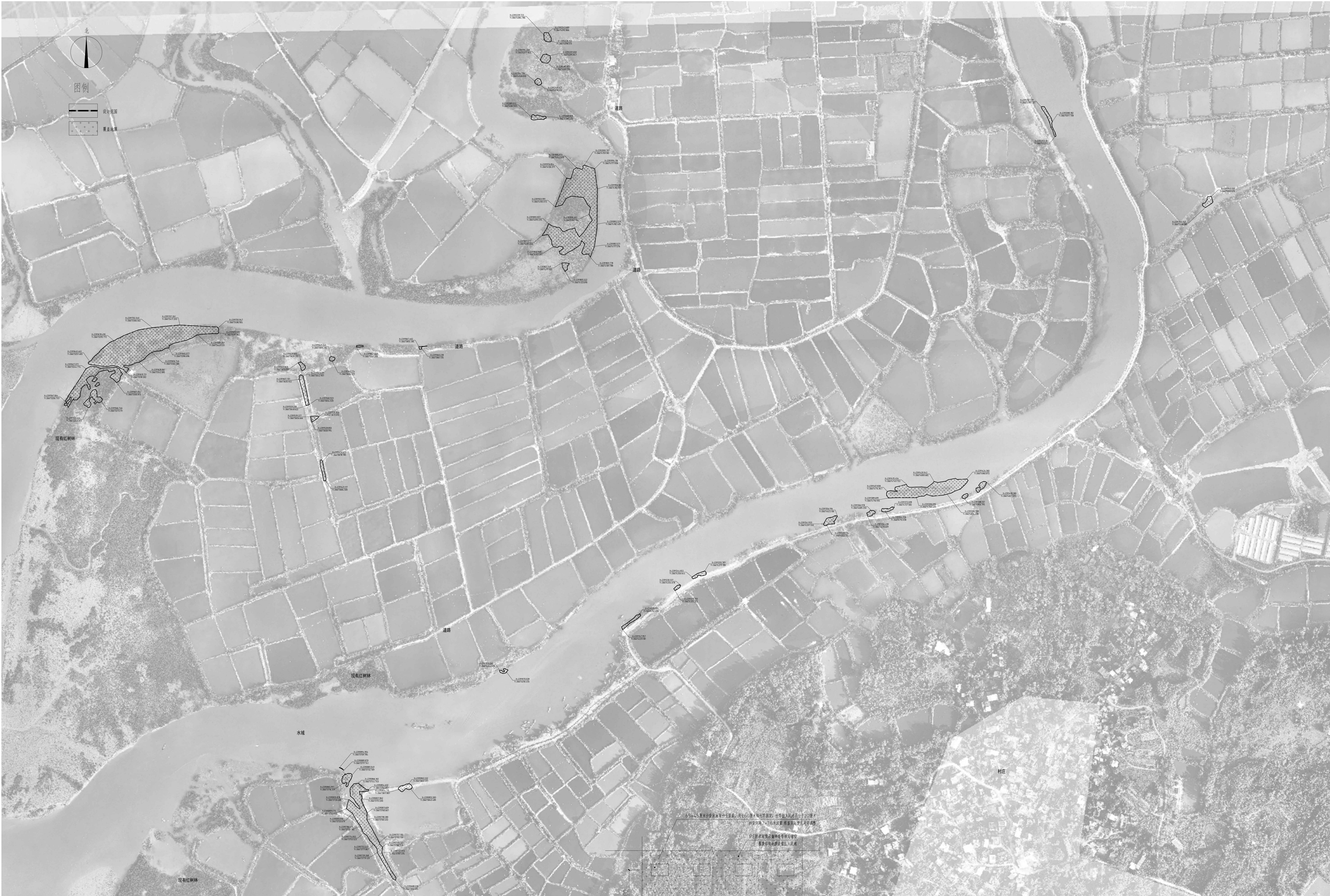
B区覆盖地膜施工平面图 1:2400